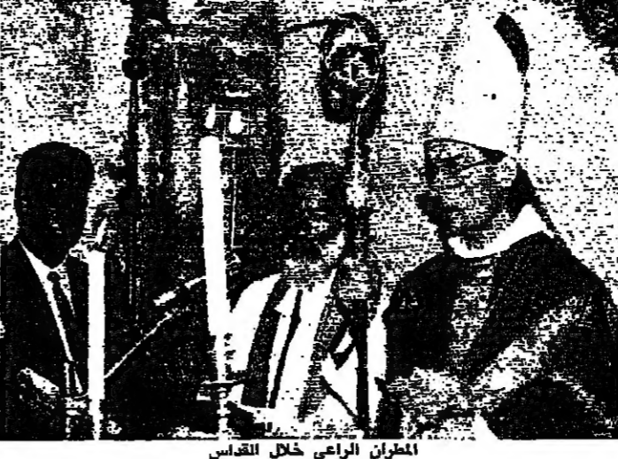
المطران الراعي خلال القداس

يلاط - من ميشال كرم دعا راعي أبرشية جبل المونية المطران بشارة الراعي الى اسقاط كل العبادات للانسان التي يفهمها الانسان في حياته، من صمم الذات والجاه والطبيقة والمال، الى صمم الابحية والعنف والتسلط. وحث المؤمنين على التمسك بروح الصلاة والامان على غرار ابيائنا التي لكي يعفنا الرب في سبيلنا من هذا الصراع الصعب، وصراع السلام ضد الحرب. وقال المطران في خطبته: « هذا السيف الذي نراه في صورة ابياتنا التي، اي السيف المقاطع وليس المقاطع على رؤوس الآخرين، بل السيف الذي يقطعه على انفسنا وعلى سبيلنا، هو سبيلنا الى العبادات للانسان التي يفهمها الانسان في حياته، من صمم الذات والجاه والطبيقة والمال، الى صمم الابحية والعنف والتسلط. وحث المؤمنين على التمسك بروح الصلاة والامان على غرار ابيائنا التي لكي يعفنا الرب في سبيلنا من هذا الصراع الصعب، وصراع السلام ضد الحرب.